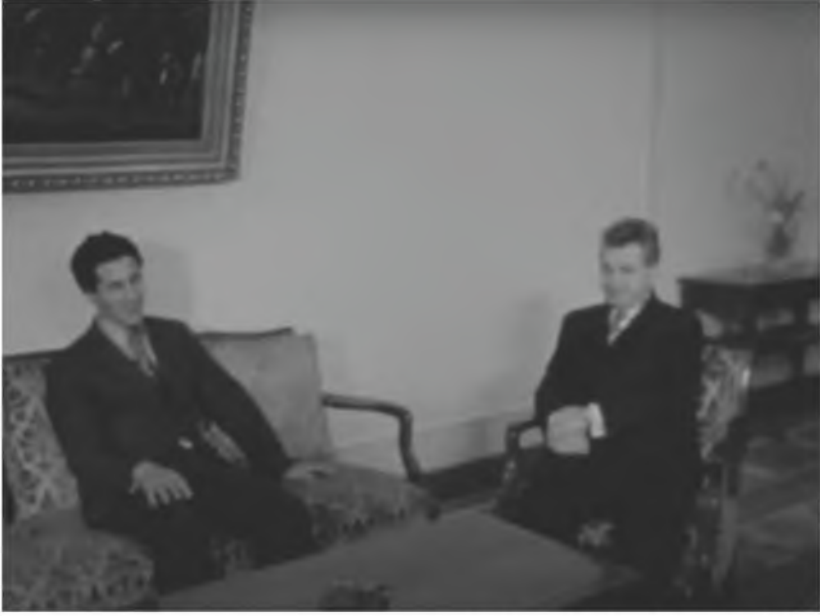
زيارة عبد السلام جلود لنيكولاي تشاوشيسكو، رئيس رومانيا، 12/3/1972.